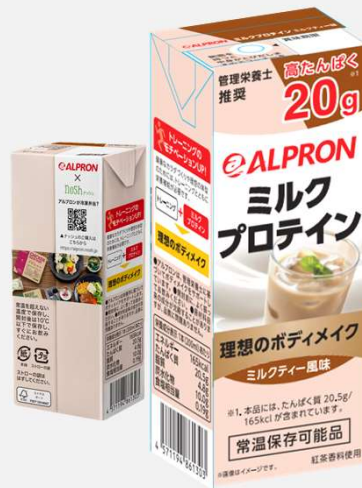
ミルクティー風味 200ml