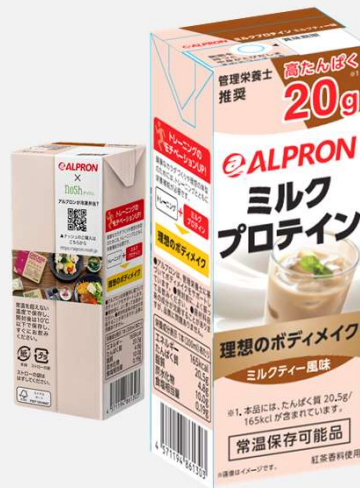
ミルクティー風味 200ml